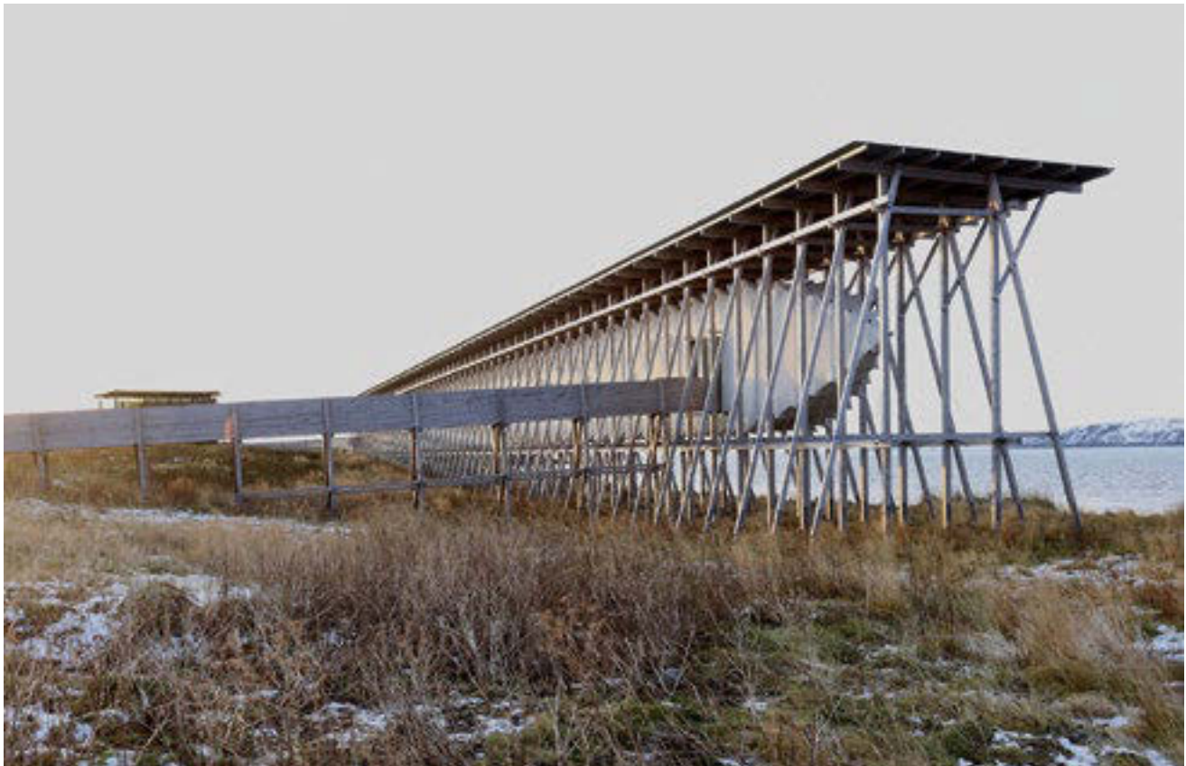
Das Steilneset-Mahnmal besteht aus einer lang gezogenen Holzkonstruktion (Peter Zumthor) und einem von Louise Bourgeois bespielten Glaspavillon (links im Hintergrund).