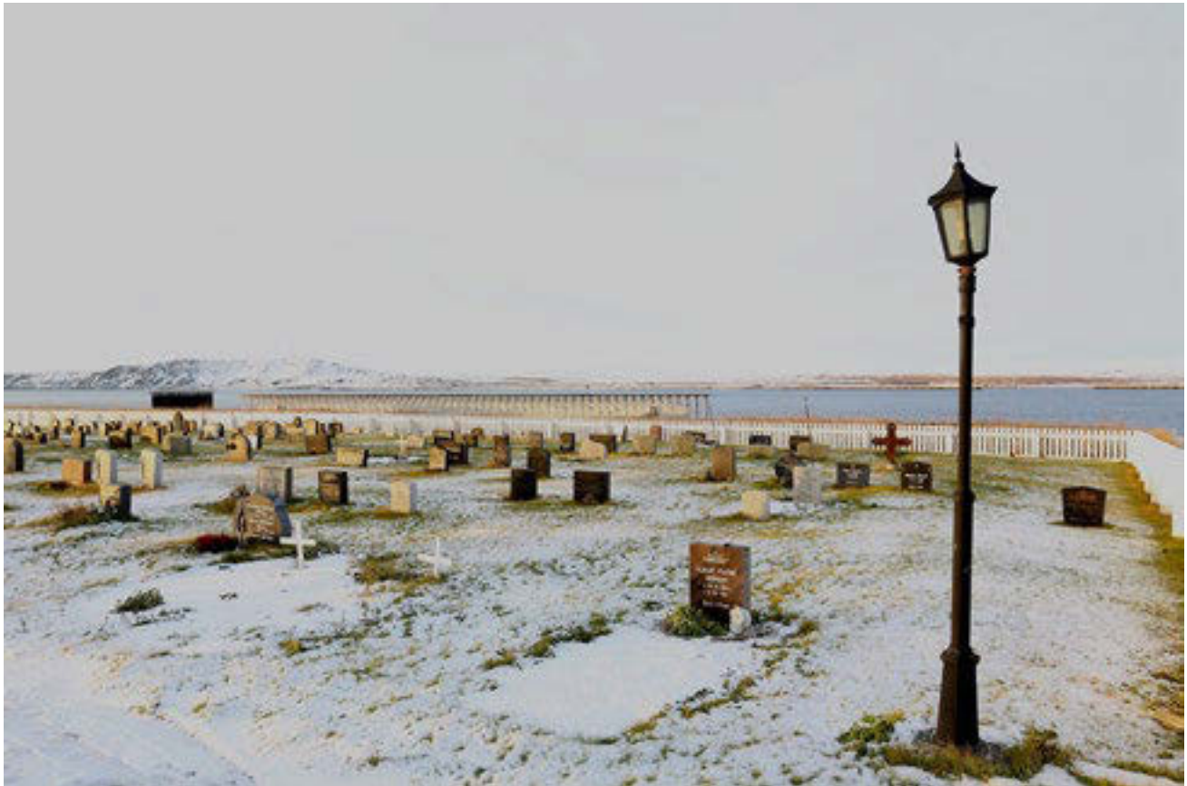
Das Mahnmal liegt am Ufer der Barentssee. Dort wurden die Beschuldigten jeweils der Wasserprobe unterzogen: Schwammen sie obenauf, war das ein Zeichen für ihren Pakt mit dem Teufel.